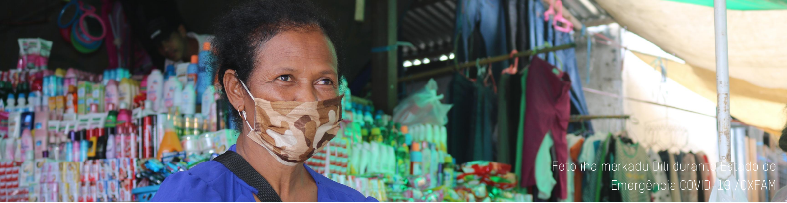
Feto iha merkadu Dili durante Estado de Emergência COVID-19