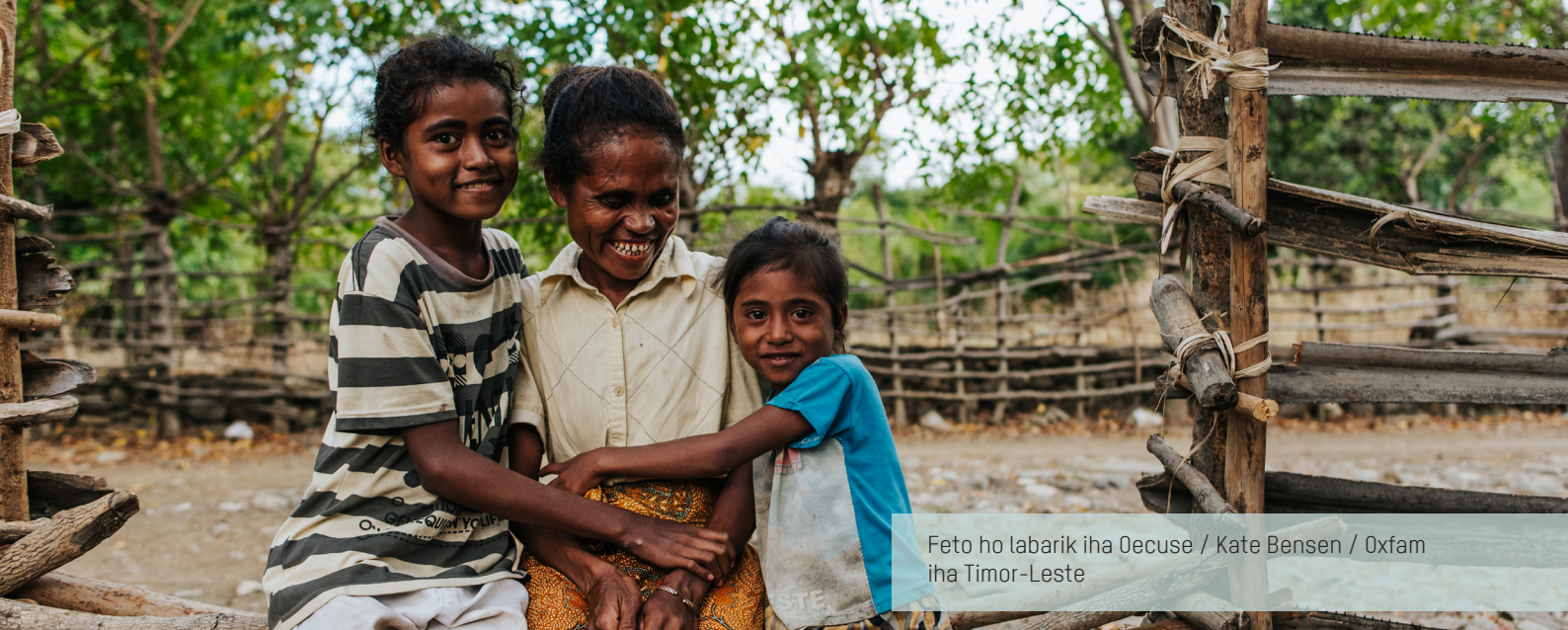
Feto ho labarik iha Oecuse