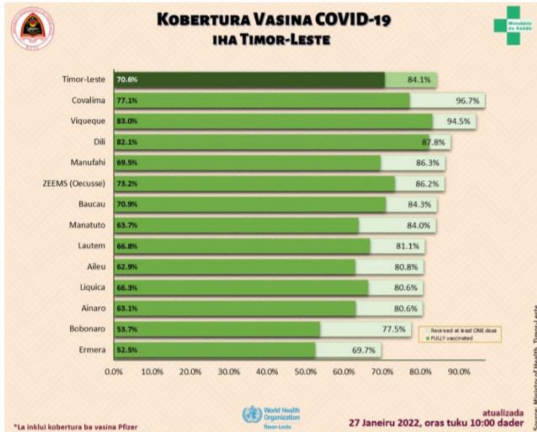
Grafiku n o 1 - Progresu vasina hasoru Covid-19 iha Timor

N.B: atu bele hetan imunidade grupu ka "herd immunity", hodi bele satan transmisaun virus corona iha populasaun nia le'et, pelu menus 70% husi populasaun Timor-Leste tenki hetan vasina kompletu/ka doze rua.