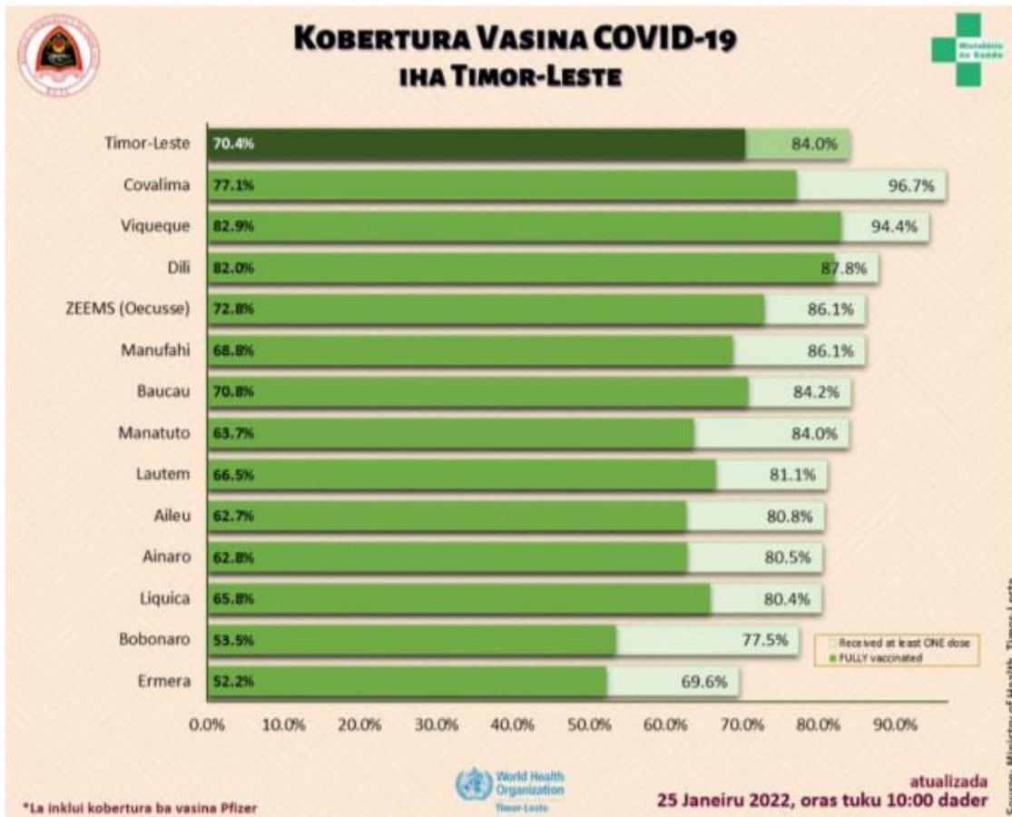
Grafiku n°1 - Progresu vasina hasoru Covid-19 iha Timor

N.B: atu bele hetan imunidade grupu ka “herd immunity”, hodi bele satan transmisaun virus corona iha populasaun nia le’et, pelu menus 70% husi populasaun Timor-Leste tenki hetan vasina kompletu/ka doze rua.