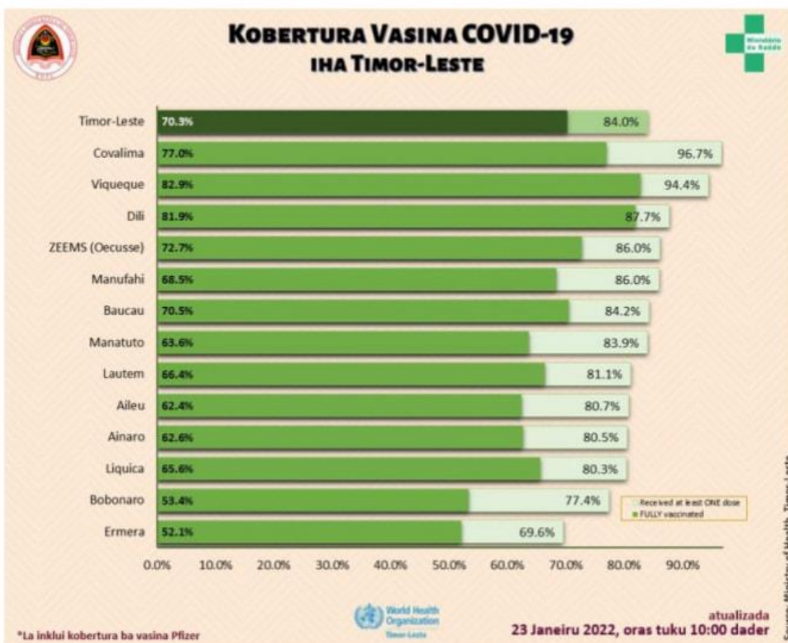
Grafiku n o 1 - Progresu vasina hasoru Covid-19 iha Timor

N.B: atu bele hetan imunidade grupu ka "herd immunity", hodi bele satan transmisaun virus corona iha populasaun nia le'et, pelu menus 70% husi populasaun Timor-Leste tenki hetan vasina kompletu/ka doze rua.