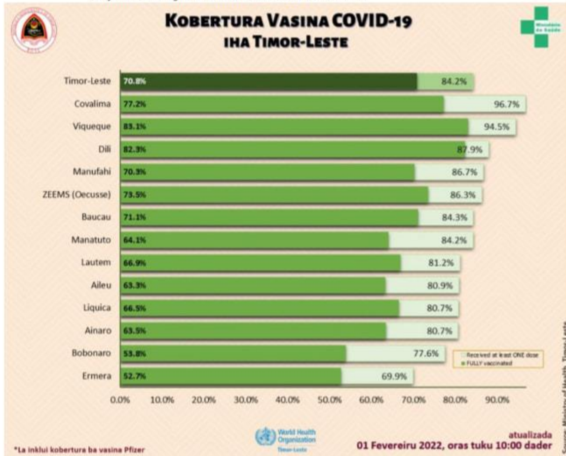
Grafiku n°1 - Progresu vasina hasoru Covid-19 iha Timor

N.B: atu bele hetan imunidade grupu ka "herd immunity", hodi bele satan transmisaun virus corona iha populasaun nia le'et, pelu menus 70% husi populasaun Timor-Leste tenki hetan vasina kompletu/ka doze rua.